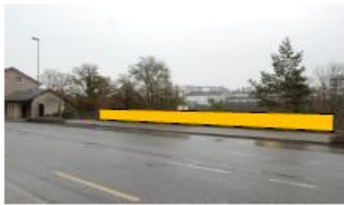
Am Geländer der talseitigen Bushaltestelle Finsterwaldstrasse