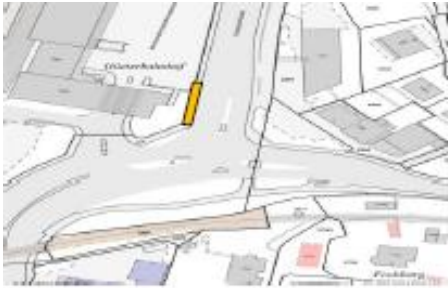
Am Geländer, Seite Güterbahnhof