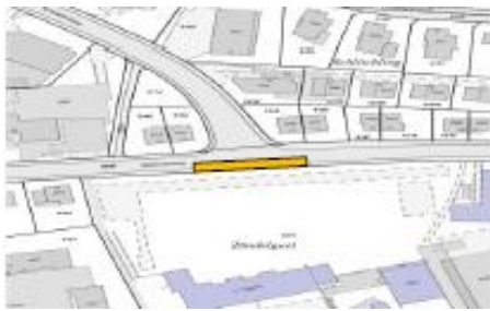
Am Geländer, Höhe Einmündung Kesselstrasse