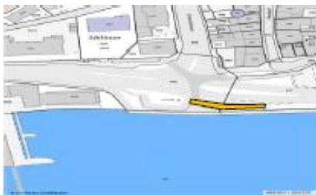
Am rheinseitigen Geländer, Höhe Moser-Denkmal