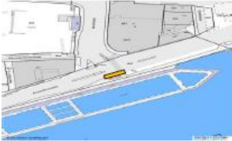
Am Geländer, Verzweigung Rheinuferstrasse - Bachstrasse