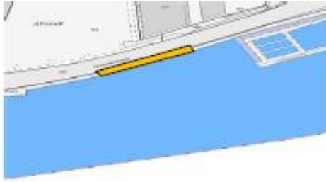
Am Geländer, unterhalb der Rhybadi