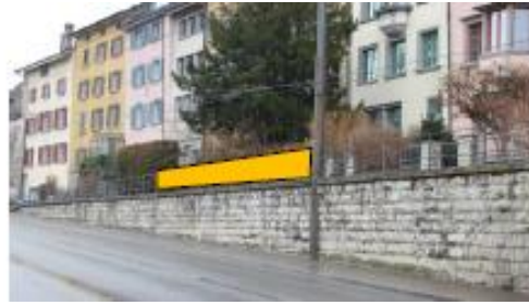
Am Geländer, oberhalb Haberhausbrücke, Seite Neustadt