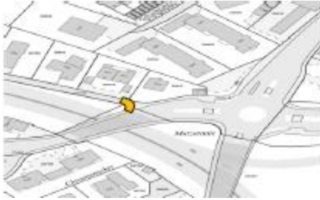
Am Geländer, Strasseneinmündung Mutzentäli