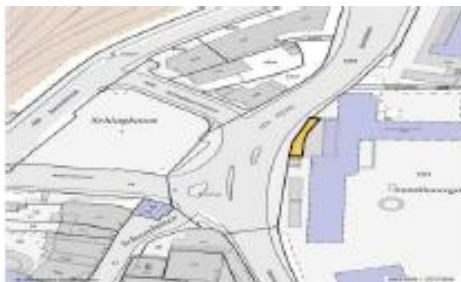
Am Geländer, beim Schulhaus Gelbhausgarten