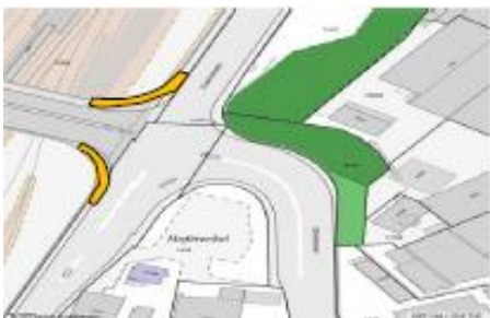
Am Geländer, Seite Güterbahnhof