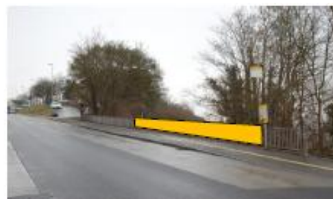
Am Geländer der talseitigen Bushaltestelle Cilag