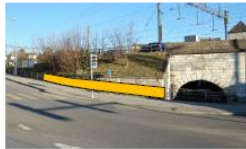
Am Geländer, bei der Bushaltestelle Durach